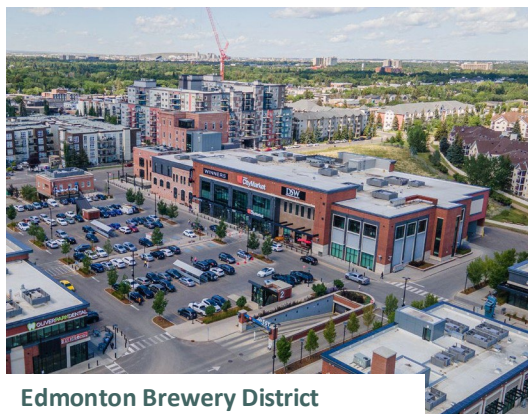
Edmonton Brewery District