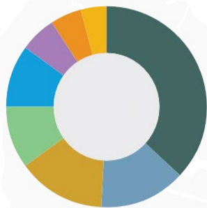
% des loyers minimaux annuels*