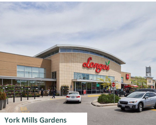
York Mills Gardens

~5,7 % TAUX DE RENDEMENT EXTRAPOLÉ DU BÉNÉFICE D'EXPLOITATION NET